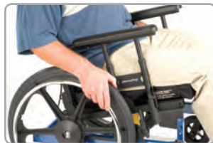
Idéal pour la propulsion manuelle.