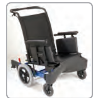
Cadre allongé en option pour une stabilité optimale. Option de rembourrage supplémentaire disponible.

Largeur du siège, standard 14 po à 22 po Largeur du siège, personnalisée 23 po à 32 po Profondeur du siège (réglable) 16 po à 22 po Hauteur du siège (réglable) 13 po à 20 po Angle du dossier (réglable) 90° à 122° Hauteur du dossier 18 po à 26 po Inclinaison dynamique 20°