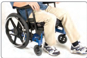
Idéal pour la propulsion avec les pieds.

CADRE AUX COULEURS À LA MODE. POSSIBILITÉ DE COMMANDER DES COULEURS PERSONNALISÉES. COMMUNIQUEZ AVEC NOUS POUR OBTENIR PLUS DE DÉTAILS.